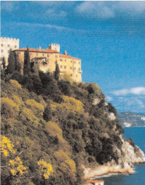
Il Castello di Duino