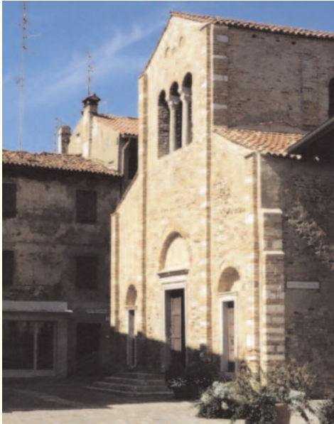
Grado – Santa Maria delle Grazie